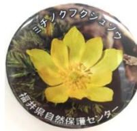
ふくいの生き物缶バッジ