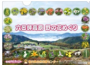
野の花クリアファイル