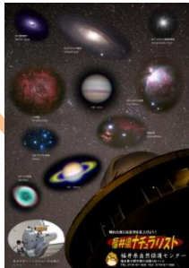
天文クリアファイル

以下の中から、お好みのグッズをプレゼントします。グッズ数には限りがありますので、お早目にお申し込みください。