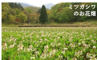
ミツガシワ のお花畑