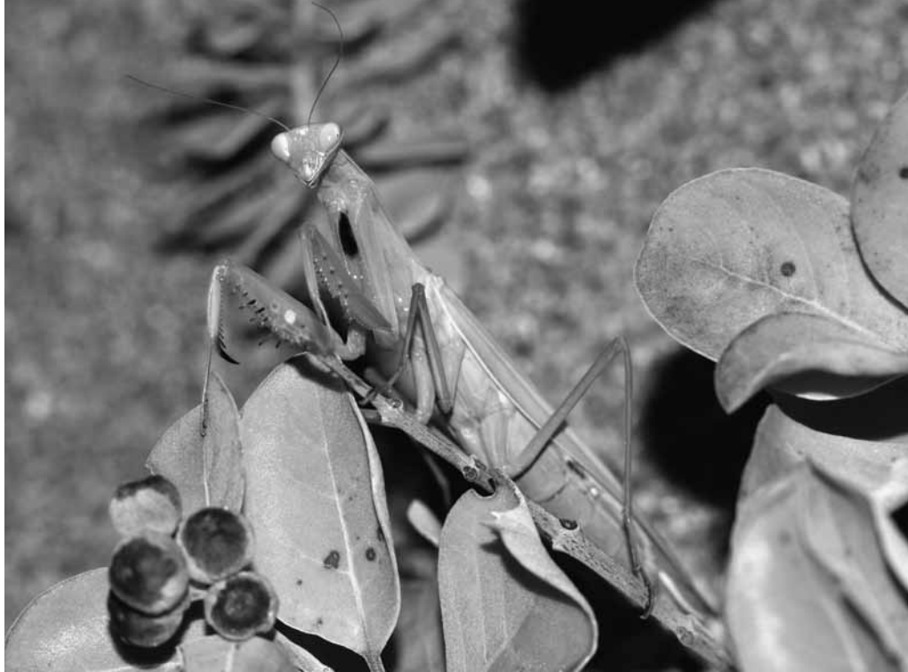
図1 ハマゴウで見つかったウスバカマキリ (三里浜, 18-IX-2017)。

近隣の石川県では、加賀市、小松市、珠洲市の海岸や手取川河川敷で記録があるほか (富沢 2007)、最近では海岸や河川敷から離れた工場敷地内にある造成後の草地 (富沢 2013) や田園地帯の草地 (石川 2015) でも確認されている。一方、福井県内では高浜町音海と永平寺町下合月の2地点が生息地として知られているのみで (長田 1985; 下野谷 2000)、1997年を最後に確認されていなかった。県内における生息状況は十分に把握されていないことから、改訂版 福井県レッドデータブックでは本種は要注目に選定されている (福