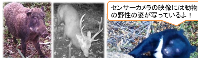
センサーカメラの映像には動物の野性の姿が写っているよ！

開催日 4月27日～7月中旬まで 場所 自然保護センター（1階レクチャーホール） 時間 9:00～17:00 随時受付