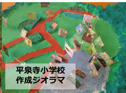
平泉寺小学校 作成ジオラマ