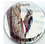
ふくいの 生き物缶バッジ

一度登録すれば、来館のたびに バッジ をプレゼントします。※受付にて登録証をご提示ください。