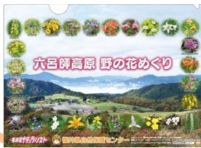
野の花クリアファイル