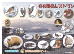
野鳥レストラン クリアファイル