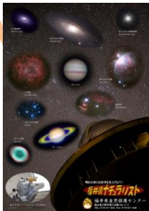
天文クリアファイル

以下の中から、お好みのグッズをプレゼントします。グッズ数には限りがありますので、お早目にお申し込みください。