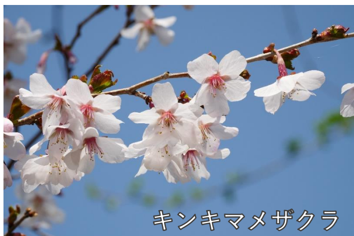
キンキマメザクラ