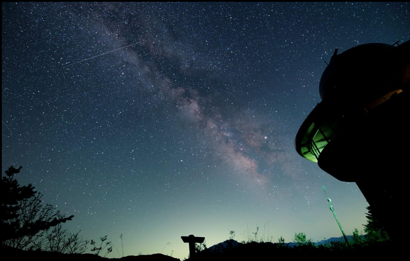
令和元年度ふくい星空写真展 センター職員Tの作品

六呂師高原で見る天の川、そして口径80cmの反射望遠鏡で観察する球状星団など、夏の星空や天体は言葉で言い表せないほどの美しさです。自然保護センターでその姿を見られる期間は限られていますので、この時期にぜひご自分の目で、そして望遠鏡を通してその美しさを感じてください。