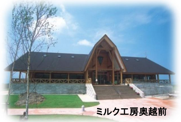
ミルク工房奥越前