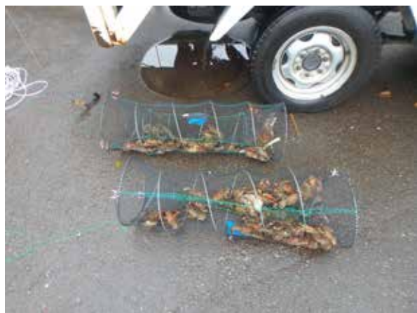
図3 円筒形のカゴ罟（2020年10月23日撮影）

雌雄を区別し、頭胸甲長を計測した後、すみやかに殺処分した。捕獲したウチダザリガニ以外の生物は速やかに再放流した。