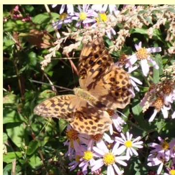
▲ オオウラギンスジヒョウモン

チョウは、卵→幼虫→さなぎ→成虫と成長します。食べる物の無い冬は、さなぎで過ごす種類が多いかと思いきや、実は、幼虫や成虫の姿で冬を越す種類も多くいて、それぞれメリットがあるようです。