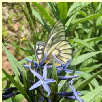
▲ ウスバシロチョウ

小さな卵は敵に見つかりにくく、春にうまれた幼虫はやわらかな草を食べることができます。