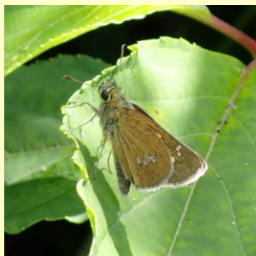
▲ オオチャバネセセリ

枯葉の裏でじっとしたり、 巣をつくったりして冬を越 し、春になるといち早く動 き出します。